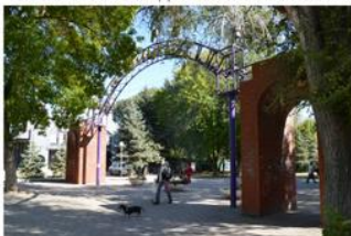
ФОТОГРАФИЯ ВХОДА С УЛ.ПЕРВОМАЙСКОЙ